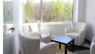
Votre salle d'entrevue !