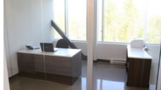
Votre bureau !