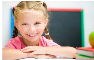
Votre contribution au bien-être!