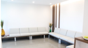
Votre salle d'attente